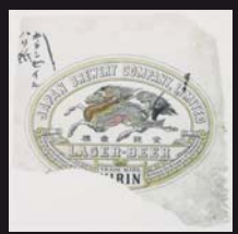
上田市山本鼎記念館所蔵

山本 鼎 (やまもと かなえ、1882-1946) は、愛知県岡崎市出身で、長野県上田市に移住し、児童自由画教育や農民美術運動のなかに身を投じた版画家、洋画家、教育者である。その山本鼎が1893年頃、当時、既に使用されていたキリンビールの商品ラベルをお手本として原画を彫り、試し刷りをしたものと考えられている版画が、上田市山本鼎記念館で今でも見ることが出来る。11歳程の作品とは思えない繊細な版画だ。